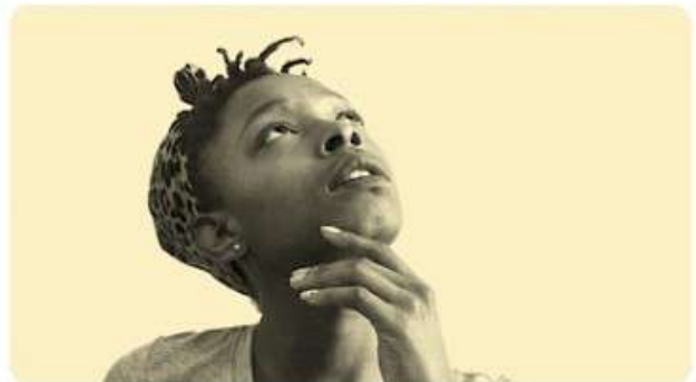
ÉCHANGES : LE GROUPE DE DISCUSSION